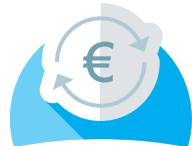
par prélèvement automatique