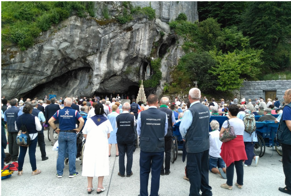
Pèlerinage diocésain à Lourdes