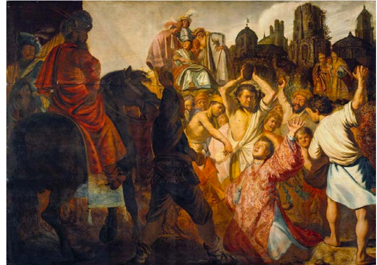
La Lapidation de Saint Etienne, Rembrandt, 1625, Musée des Beaux arts de Lyon