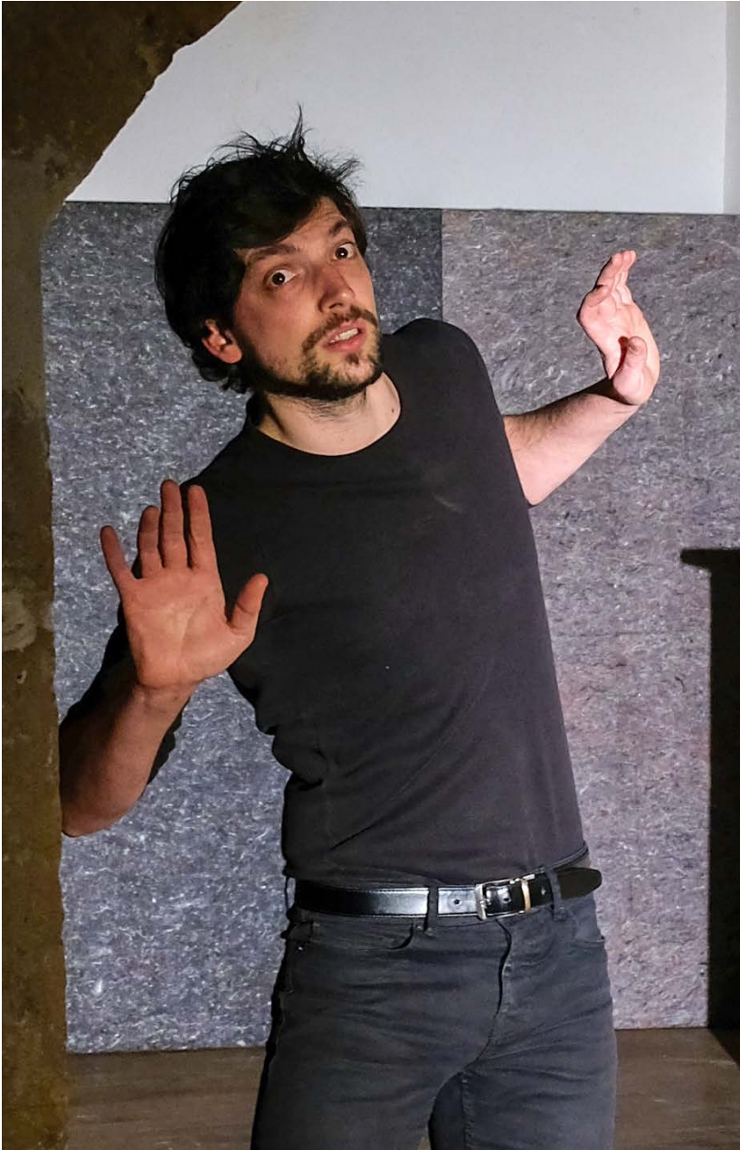
Photo de répétition, février 2021