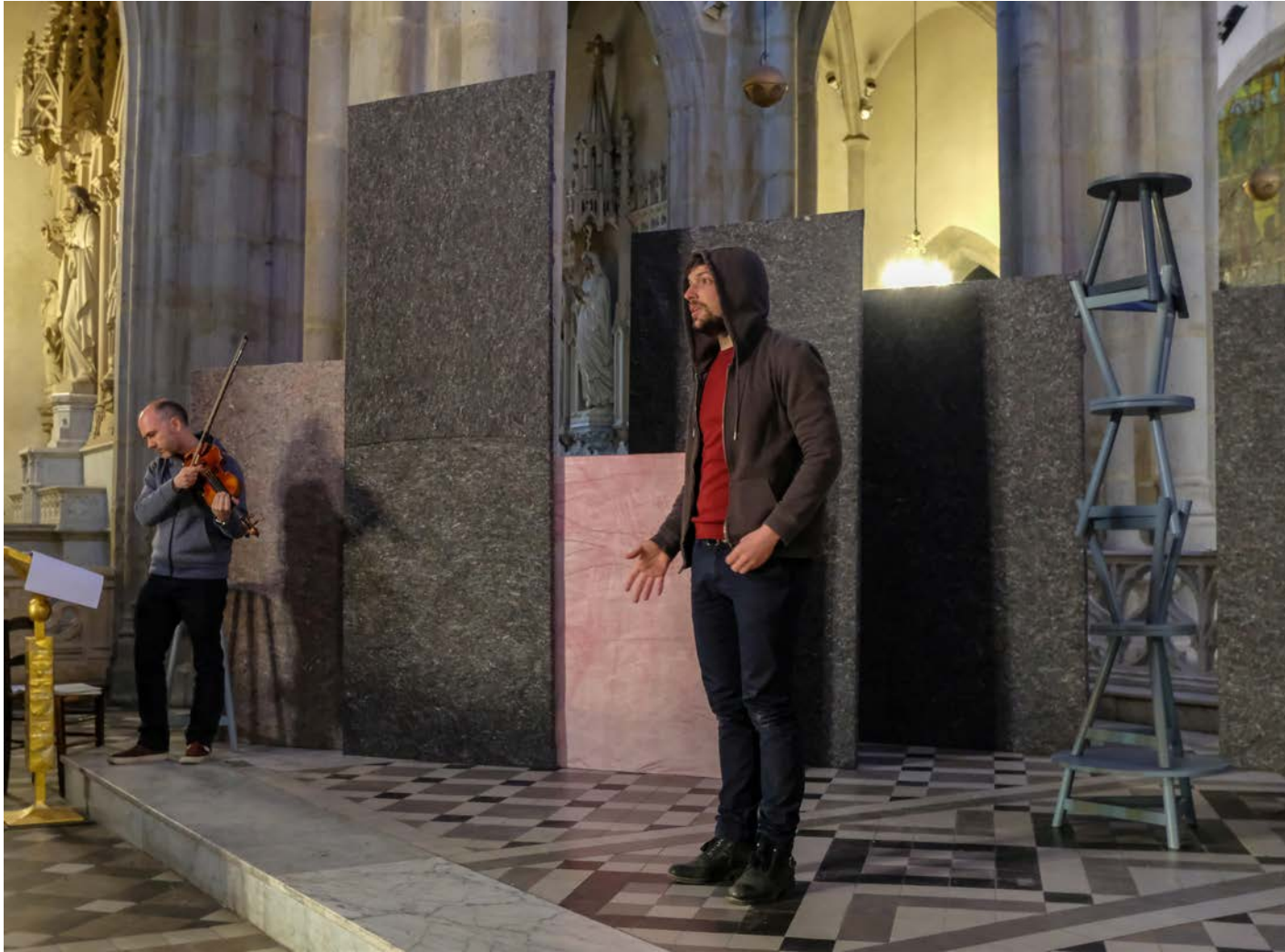
Photo de répétition, avril 2021