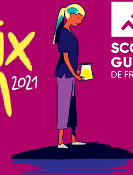
Illustration: Matthieu Méron