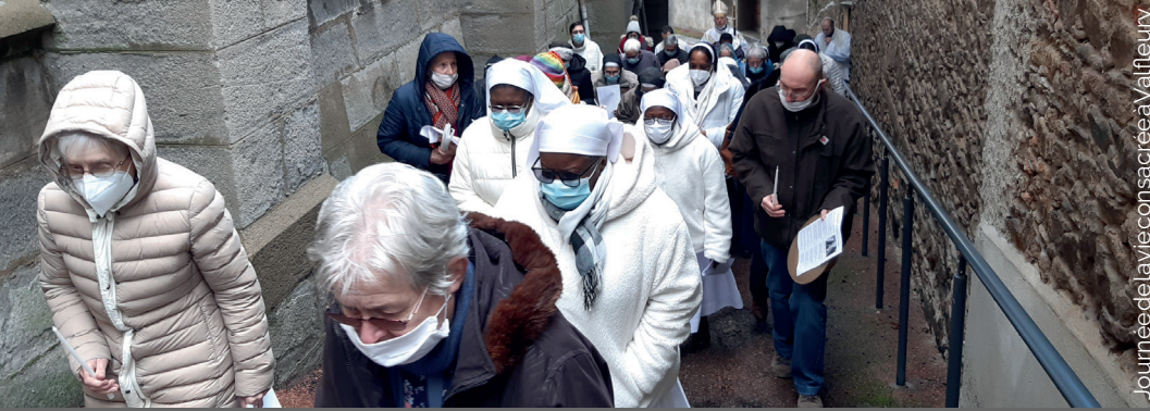
Jour née de la vie consacrée à Valfleury