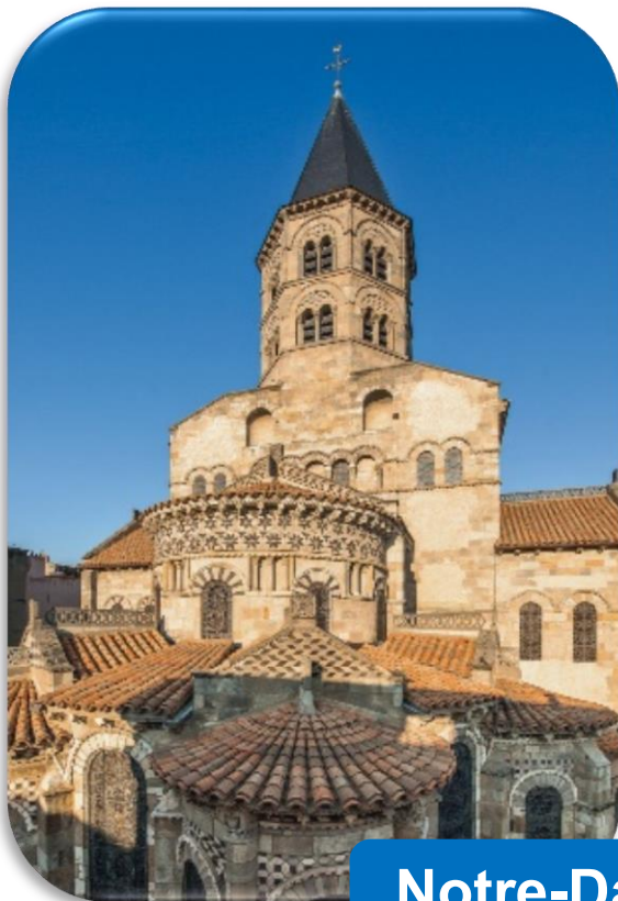
Notre-Dame du Port