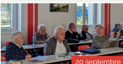
Récollecion annuelle des prêtres âgés.