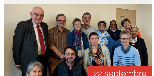
Journée de rentrée des LEME de la Pastorale de la santé.