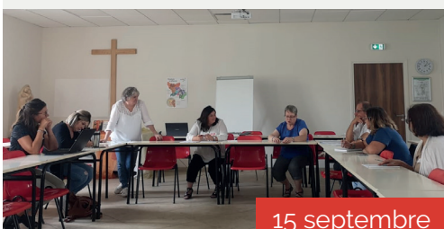
Journée de rentrée des LEME de l'initiation chrétienne des enfants.

Mgr Sylvain Bataille Évêque du diocèse de Saint-Étienne