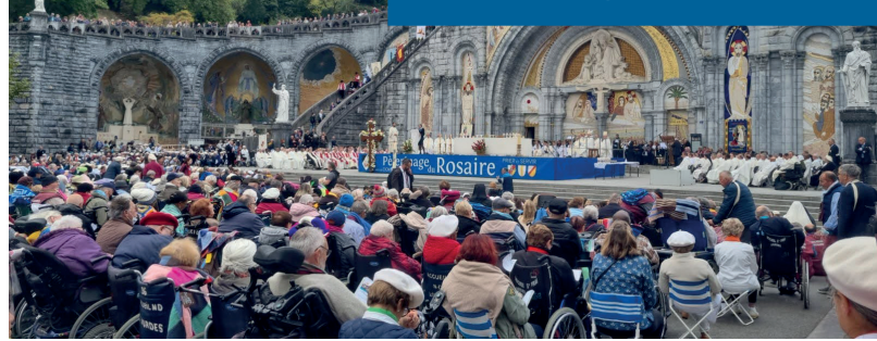
Pèlerinage du Rosaire, octobre 2022

intentions de prière des uns et des autres. Le livret propose également une intention du Pape François. Pour moi, c'est une joie de retrouver l'équipe, de prier aux intentions de chacun et chacune, d'avoir un temps fort de partage et de communion. Il y a une attente des uns et des autres pour participer à ces rencontres. C'est un besoin. Il y a une communion qui passe à travers cette équipe. Cela ressemble aux fraternités locales, mais là, nous nous réunissons sous le regard de Marie. La vie de l'équipe en dehors des temps de prière est également très importante. Nous avons une mission, celle d'annoncer le Christ, avec Marie, sous l'action de l'Esprit Saint.