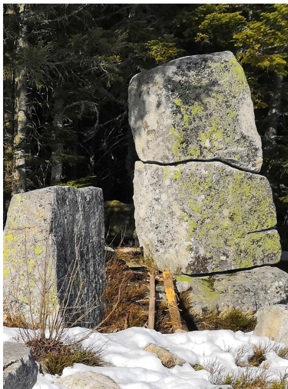
Idee d'un désert à la façon du Pilat... !