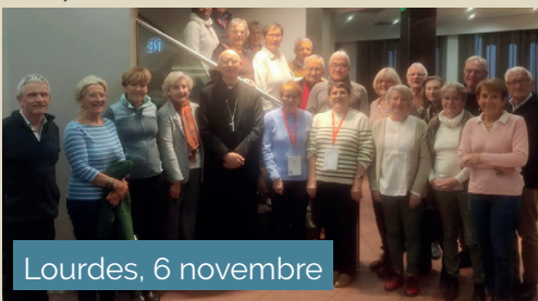
Lourdes, 6 novembre

À l'occasion de la grande rencontre chorale des Ancolies (association des chorales liturgiques) à Lourdes, la délégation venue de la Loire rencontre Mgr Bataille, présent pour l'Assemblée plénière des évêques de France.