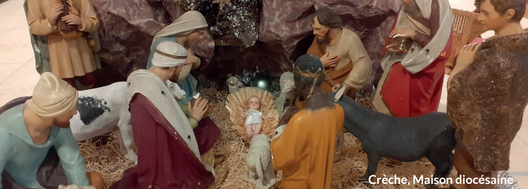
Crèche, Maison diocésaine