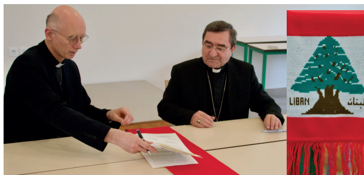
Signature de la charte du jumelage

nous préparons la venue d'une délégation libanaise, avec plusieurs propositions d'animation le jour J.