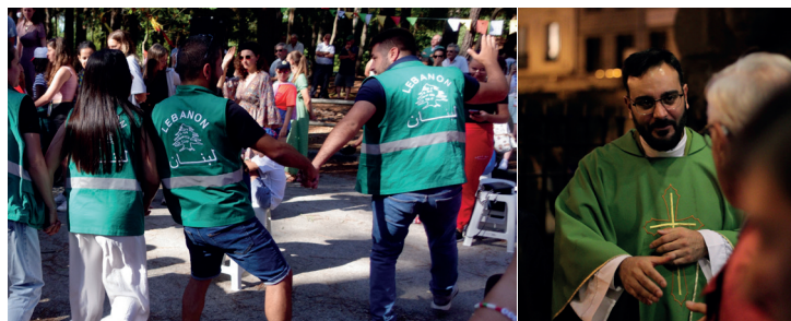
Jeunes libanais avec le groupe de Saint-Étienne - JMJ 2022