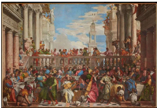
Les noces de Cana de Véronèse - Musée du Louvre

Plus d'une cinquantaine, nous nous sommes répartis en petits sous-groupes de 6-7 personnes pour examiner les attitudes qui distinguent Marie dans les récits évangéliques mais aussi au travers de différentes peintures, de toutes les époques, de la Renaissance à nos jours, représentant les passages de l'Évangile où Marie était présente.