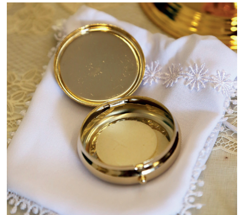
Porter la communion à ses frères

Le retour de l'Espérance chez certaines personnes qui retrouvent la foi, qui reviennent à une certaine pratique religieuse une fois sorties de l'hôpital. Il y a une reconnexion spirituelle, une reconnexion avec l'Église. La foi et la pratique religieuse pouvaient être perdues pour des raisons très diverses, et au cours du chemin que l'on fait avec eux, ils renouent parfois avec le Christ. Ça c'est une grande joie !