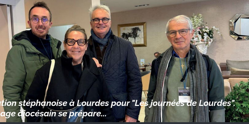
La délégation stéphanoise à Lourdes pour "Les journées de Lourdes". Le pèlerinage diocésain se prépare...