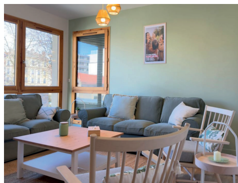
Intérieur de Familya

Non, évidemment ! Nous passerions complètement à côté de ce qui a motivé la création de cette Maison ! Si notre projet est d'inspiration chrétienne, il s'inscrit dans la tradition sociale de l'Église, pour être au service de tous. C'est d'ailleurs pour moi un moteur essentiel. Comme celui d'une véritable