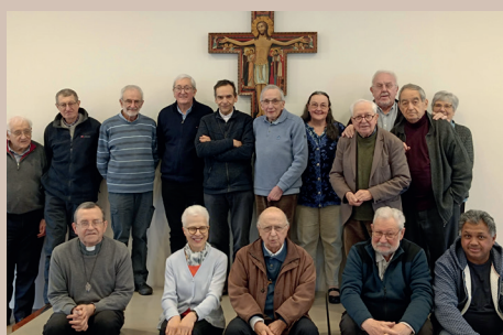
11 mars - Récollecion annuelle des prêtres âgés