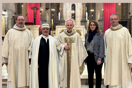
19 mars - Messe d'action de grâce des martyrs de Tibhirine