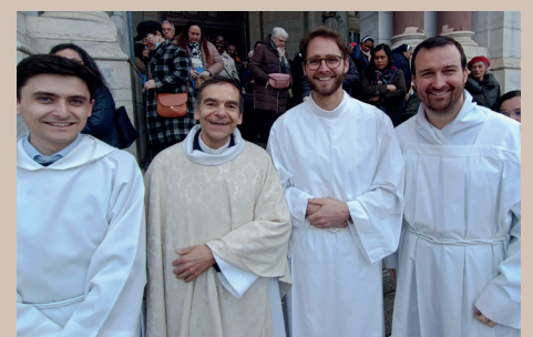
31 mars - Les séminaristes lors de la messe chrismale