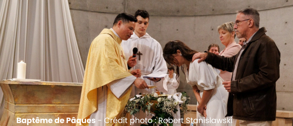
Baptême de Pâques