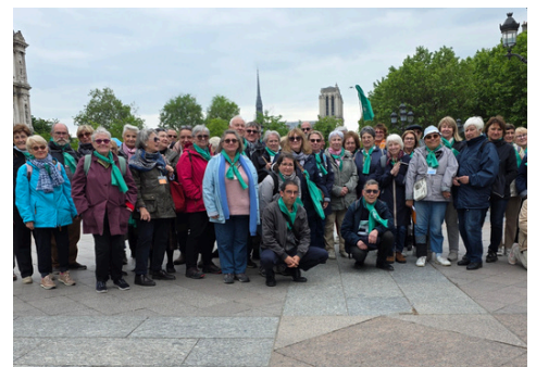
6 mai : Pèlerinage à Paris