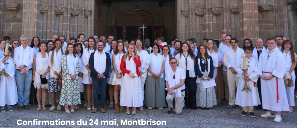
Confirmations du 24 mai, Montbrison