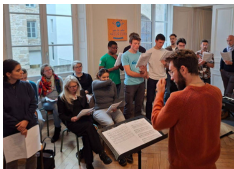
19 mai : Répétition des jeunes pour la messe de confirmation