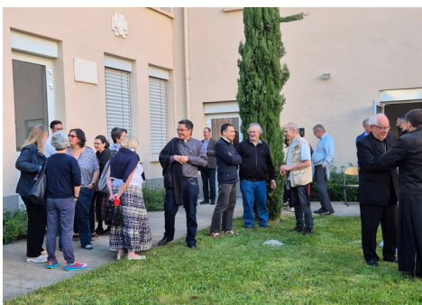
21 mai : Grand Conseil diocésain