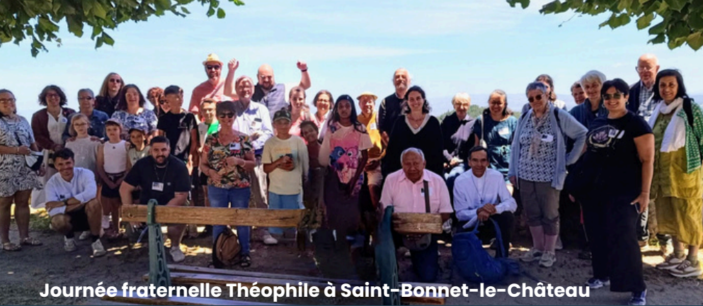
Journée fraternelle Théophile à Saint-Bonnet-le-Château