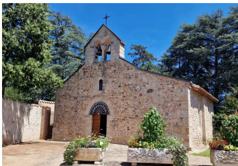
La chapelle Notre-Dame de Bonson est ouverte tous les jours

L'incendie de Notre-Dame de Paris, en 2019, a révélé l'attachement des Français à leur patrimoine religieux, mais aussi la fragilité des monuments. Et pour un grand chantier comme celui de Paris, combien de chapelles et de petites églises attendent les crédits qui les sauveront de la ruine ! Il y a cependant, au sein des municipalités comme à travers de nombreuses associations de sauvegarde, un effort considérable pour restaurer et mettre en valeur les éléments du patrimoine religieux, dont les « États généraux » de 2023-2024 ont montré toute l'importance.