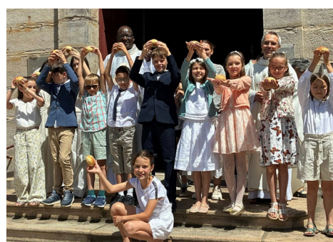
Juin : le temps des premières communions en paroisse