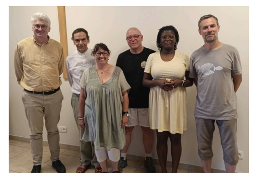
26 mai : AG de l'Association Diocésaine de Solidarité (ASD)