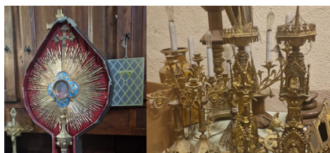
Que renferment les placards de nos sacristies ?

Ils sont des relais dans les paroisses, il y en a déjà une quinzaine. En collaboration avec eux, nous avons mis en place des fiches qui listent les différentes missions qu'ils peuvent être amenés à remplir : lien avec la DRAC ou les associations du patrimoine, inventaire des objets (classés ou non), propositions d'activités culturelles... Il est clair qu'ils ne peuvent remplir toutes les missions ; à eux de s'adapter