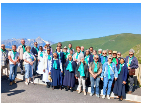
29 au 31 mai : pèlerinage au sanctuaire de La Salette